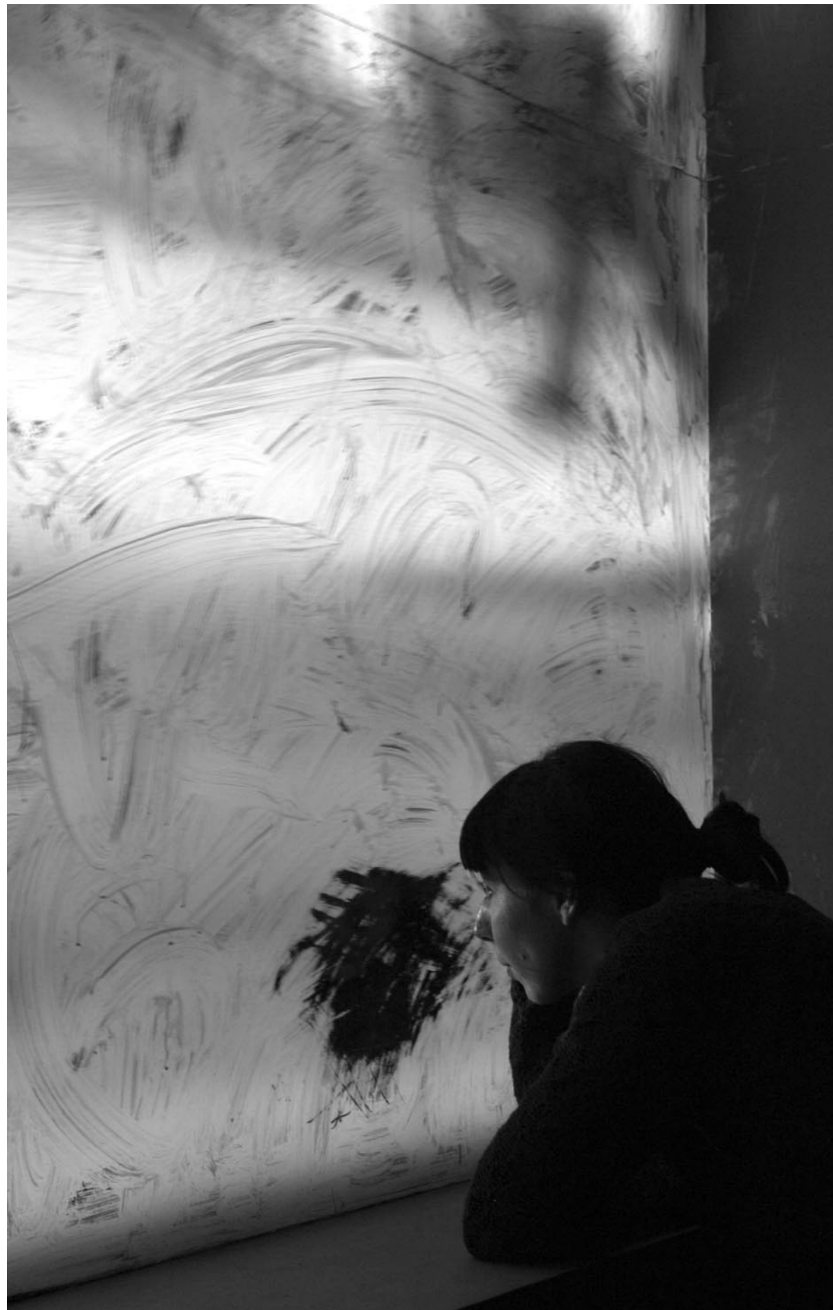
Ryan Gander, Is this guilt in you too - (Cinema Verso) , 2005, vue de l'exposition, Les Laboratoires d'Aubervilliers. Photographie : Marc Domage