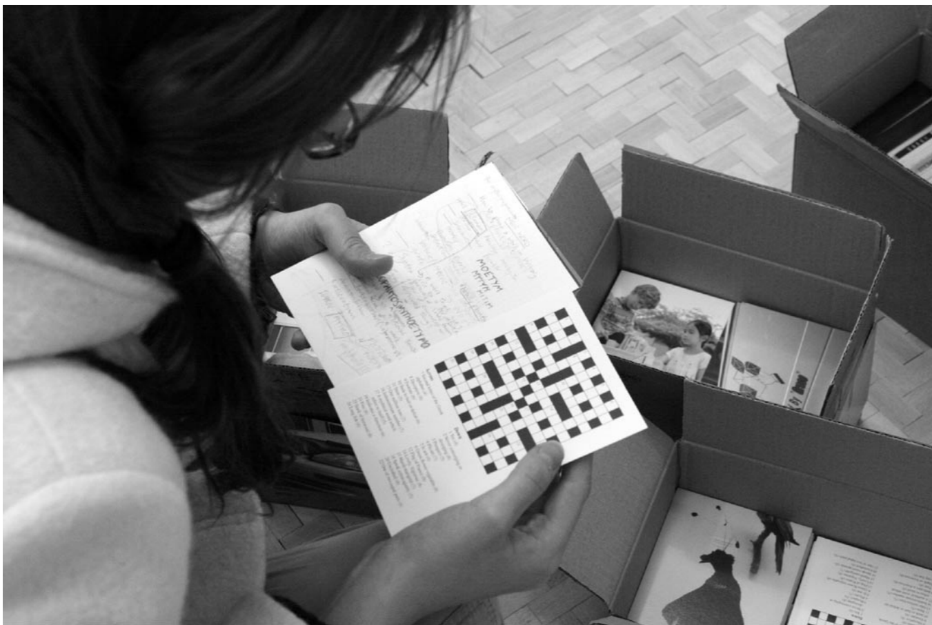
Aurélien Froment et Ryan Gander, Salle Blanche , 2005. Vues de l'exposition, Les Laboratoires d'Aubervilliers. Photographies : Marc Damage et Aurélien Froment.